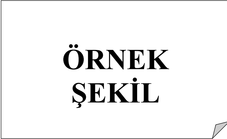
Şekil 3.2 : Birden fazla satırlı şekil isimlendirmesinde örnek, birden fazla satırlı şekil isimlendirmesinde örnek.

Lorem ipsum dolor sit amet, consetetur sadipscing elitr, sed diam nonumy eirmod tempor invidunt ut labore et dolore magna aliquyam erat, sed diam voluptua. At vero eos et accusam et justo duo dolores et ea rebum. Stet clita kasd gub rgren, no sea takimata sanctus est Lorem ipsum dolor sit amet, consetetur sadipscing elitr, sed diam nonumy eirmod tempor invidunt ut lab ore sit et dolore magna.