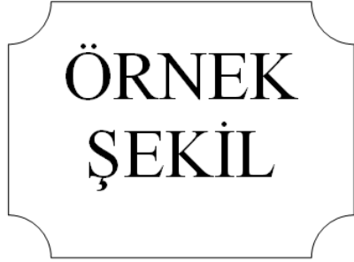
Şekil 5.1 : Beşinci bölümde örnek şekil.

This indicates that the ANN is accurate at base flow and flow height values lower than 3 m.