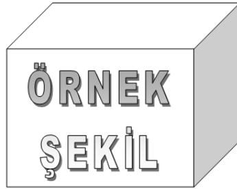
Şekil 2.1 : Tüm şekil ve çizelgeler ile bunların açıklamaları yazı bloğuna göre ortalı olarak yerleştirilmelidir.

Tüm şekil ve çizelgeler ile bunların açıklamaları yazı bloğuna göre ortalı olarak yerleştirilmelidir.