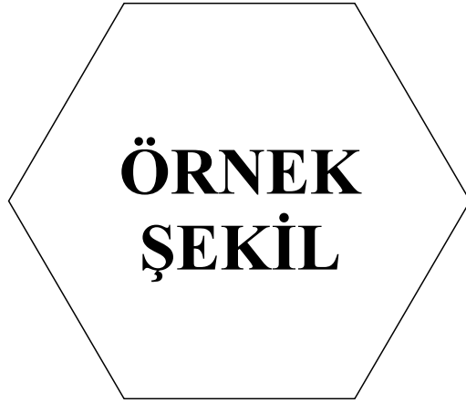
Şekil 4.1 : Örnek şekil.

Stet clita kasd gub rgren, no sea takimata sanctus est Lorem ipsum dolor sit amet, consetetur sadipscing elitr, sed diam nonumy eirmod tempor invidunt ut lab ore sit et dolore magna.