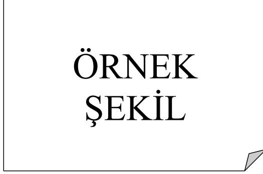
Şekil 2.2 : Üst yapılar.

Lorem ipsum dolor sit amet, consetetur sadipscing elitr, sed diam nonumy eirmod tempor invidunt ut labore et dolore magna aliquyam erat, sed diam voluptua. At vero eos et accusam et justo duo dolores et ea rebum. At vero eos et accusam et justo duo dolores et ea rebum. At vero eos et accusam et justo duo dolores et ea rebum.